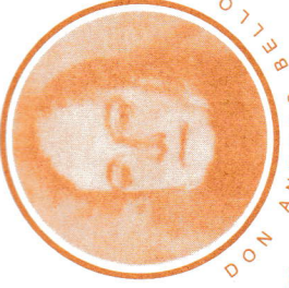
DON ANDRÉS BELLO