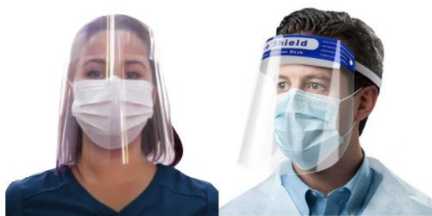
USO OBLIGATORIO EN EL DIA DEL EXAMEN

La UNIQ no se hará responsable de ningún objeto indicado como prohibido