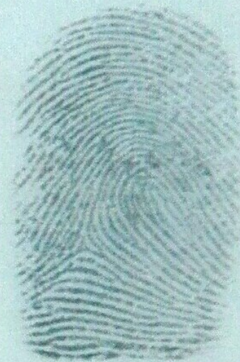
Indice derecho del menor