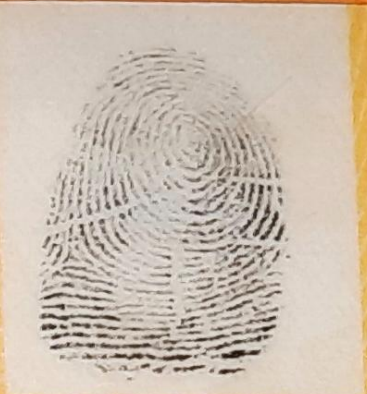
Indice derecho del menor