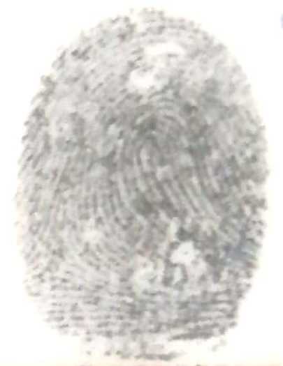
Indice derecho del menor