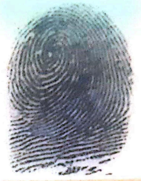
Indice derecho del menor